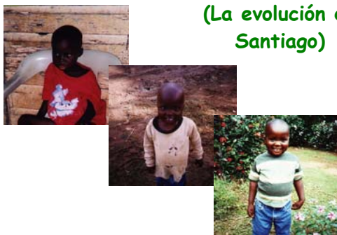
(La evolución de Santiago)